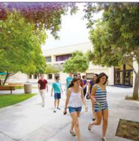
Residential Summer Centres