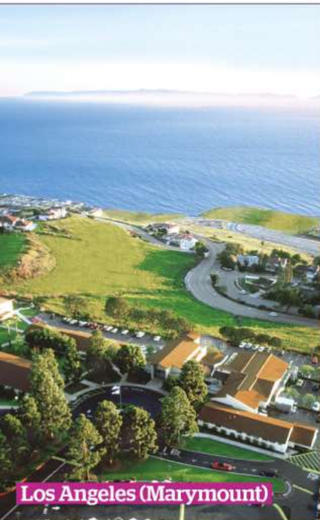
Los Angeles (Marymount)