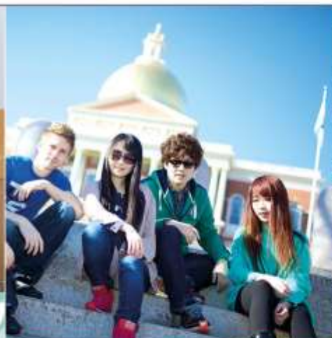
Vacation Extra Summer Centres